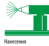
Нанесення кольорового покриття